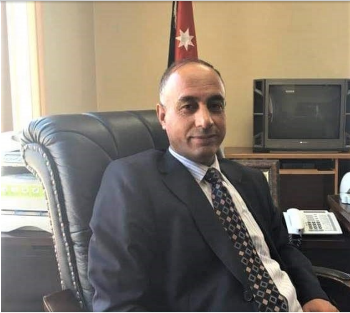
القاضي الدريدي: حان وقت استقلال الولاية العامة